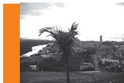
Morro de Santana: Projetos de Urbanização.

O processo de comparação entre várias soluções para um mesmo problema auxilia a decisão do gestor na